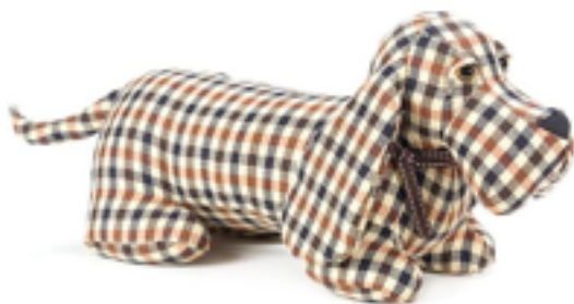
Dørstopperhund fra Dora Design https://www.designoghandelshuset.dk/