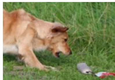
Drive-in træning