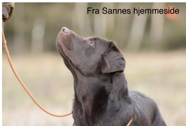
Fra Sannes hjemmeside

Opgave 7: Der sættes forstyrrelser på øvelsen med baglængsang. Godbidder på låg, kastede genstande (legetøj, bold, dummy). Hunden belønnes for at holde kontakten og ignorere forstyrrelserne