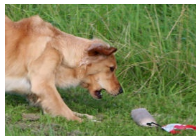
Drive-in træning

For at fremme en hurtig opsamling er det vigtigt at have et godt hjemkald, da hunden så normalt vil skynde sig at samle op. Er hjemkaldet ikke godt nok, kan man bede kursisten vende rundt og